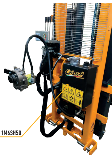
OPTIONAL COD. 1M6SH50